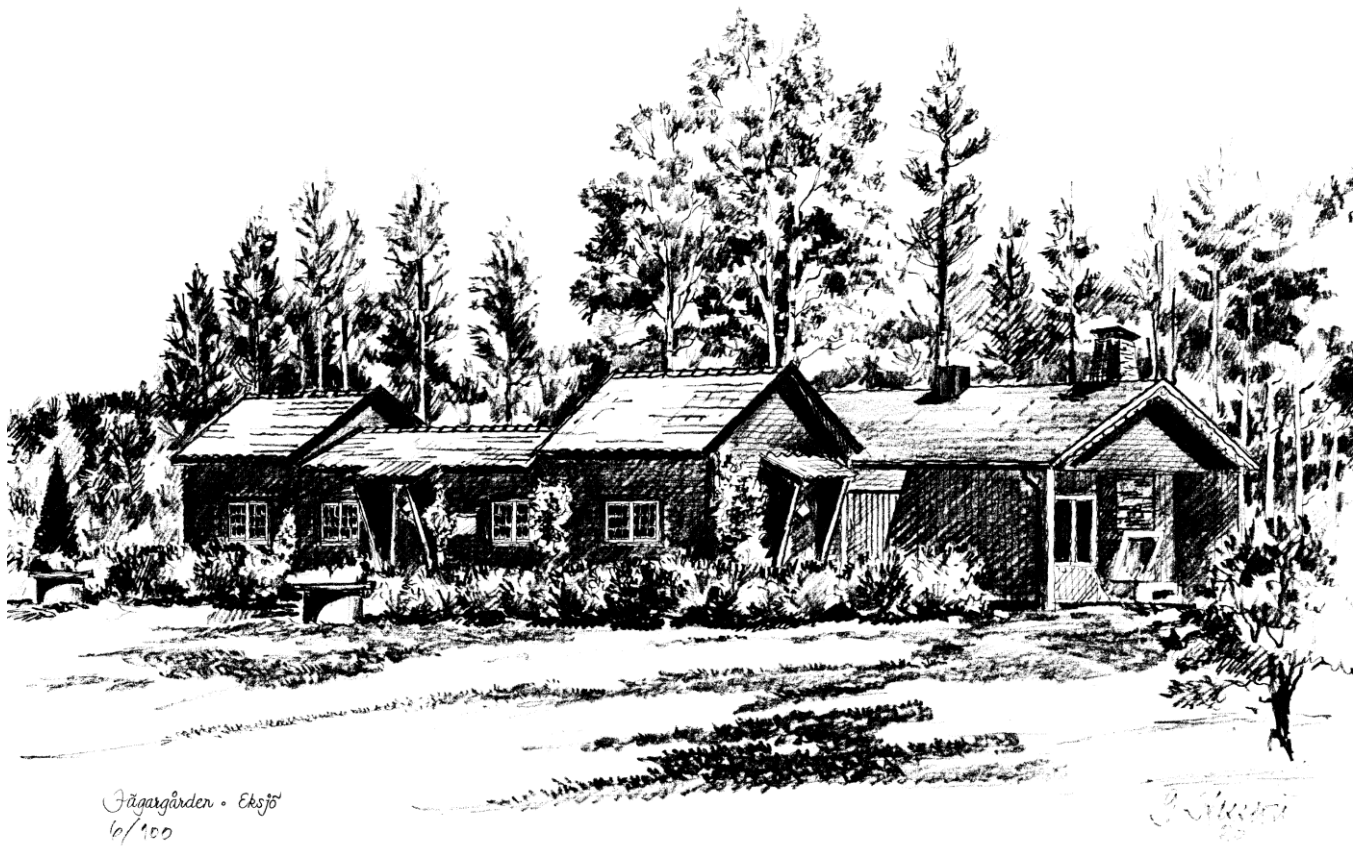
Jägargården • Eksjö 10/100

EKSJÖNEJDENS JAKTVÅRDSFÖRENING FEBRUARI 2016