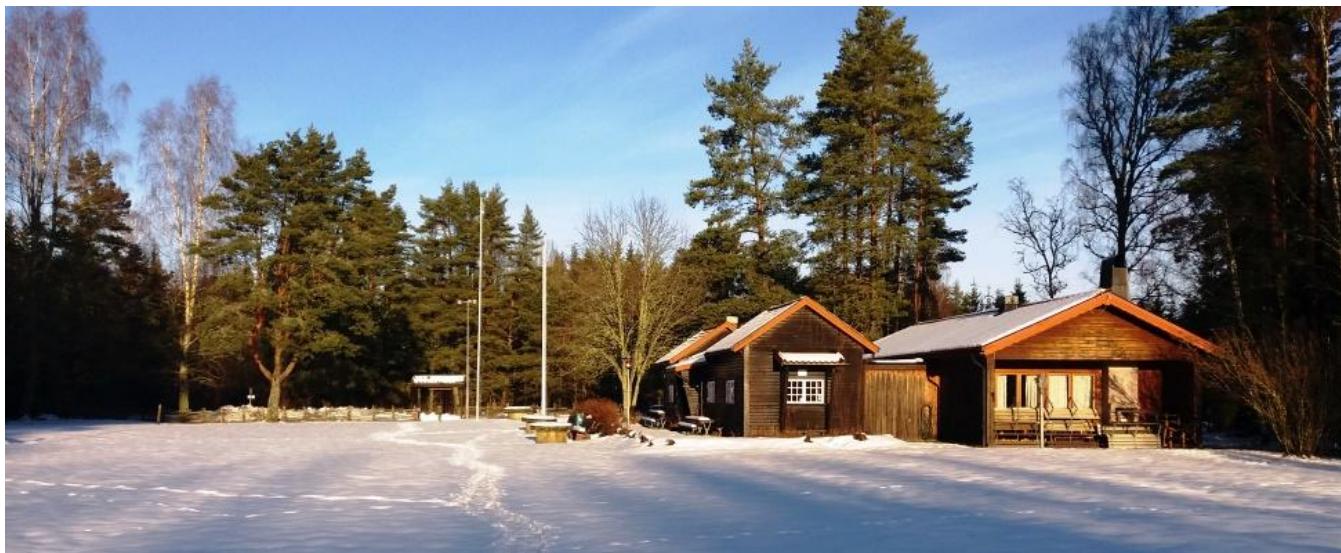
Jägaregården i vintermiljö, här syns stigen i snön som leder till inskjutningsbanan.