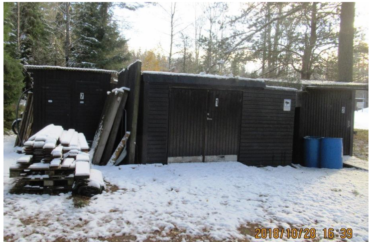
Så här såg de gamla utjänta förråden ut