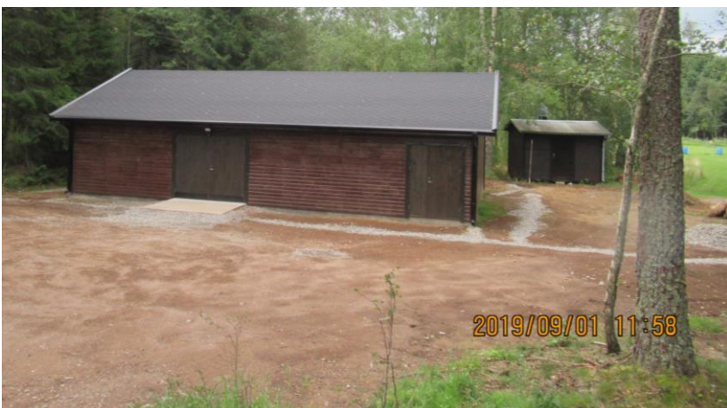
Så här blev det 106 m 2 färdiga förrådet.